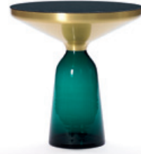
smaragd-grün emerald green