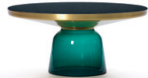
smaragd-grün emerald green