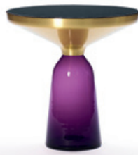
amethyst-violett amethyst violet