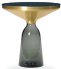
Bell Side Table | quarz-grau quartz grey

Mesa auxiliar | Mesa de centro. Pie en vidrio soplado disponible en diferentes colores. Sobre de metal con encimera de cristal lacado. Elaborada a mano.