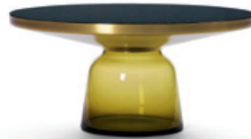
citrin-gelb topaz yellow