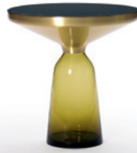
citrin-gelb topaz yellow