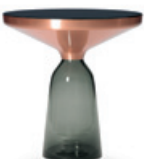
BELL SIDE TABLE COPPER 2013 Special Edition | quarz-grau quartz grey