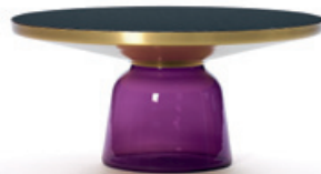
amethyst-violett amethyst violet